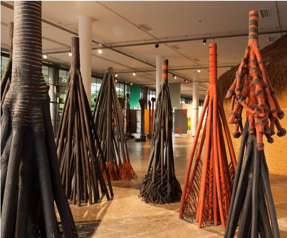
Rez-de-chaussée de la 32ème Biennale de São Paulo, œuvre « Gordinhos, Bailarinas e Coqueiros », de Frans Krajcberg, 2016.